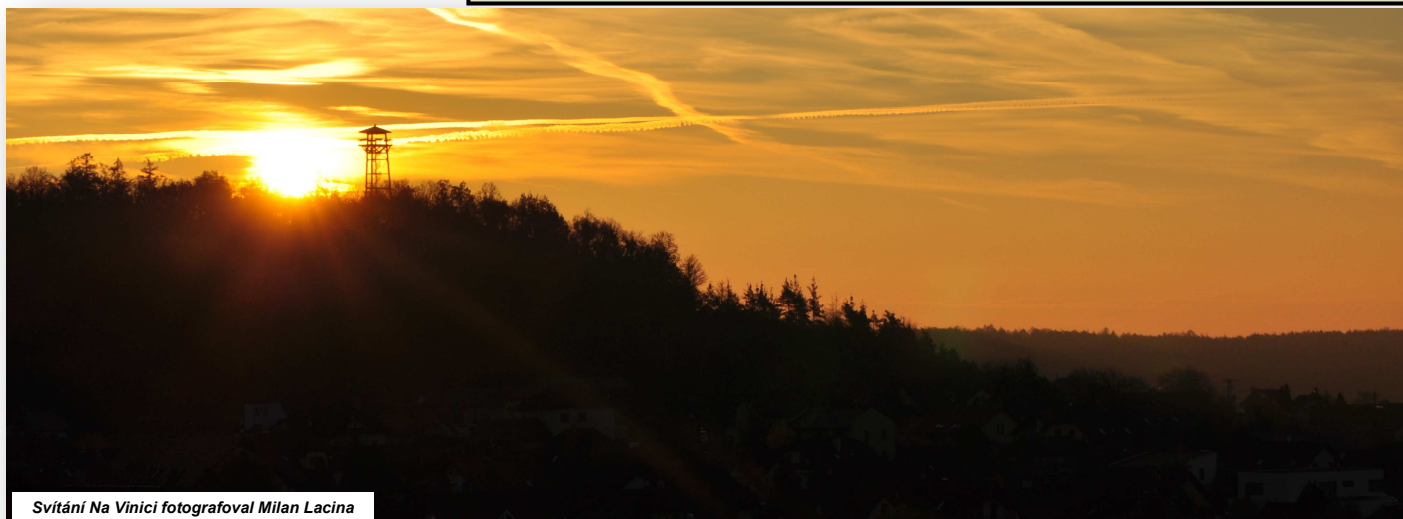
Svítání Na Vinici