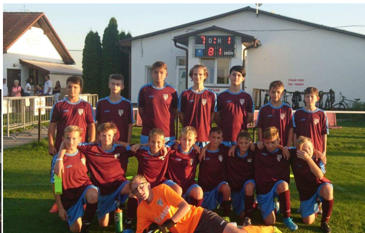
Starší žáci ročník 2006, 07,08,09, hrající Okresní přebor U-14