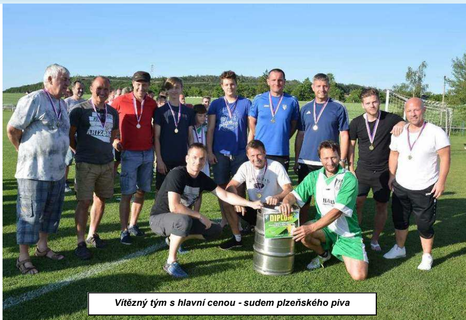
Vítězný tým s hlavní cenou - sudem pilsněského piva

Vítězství si odnesla samozřejmě Vysoká nad Labem, konkrétně tým Vysoká 1, stříbrnou medaili měl Československý tým Brusel a třetí byli po obětavém výkonu Novohradečáci.