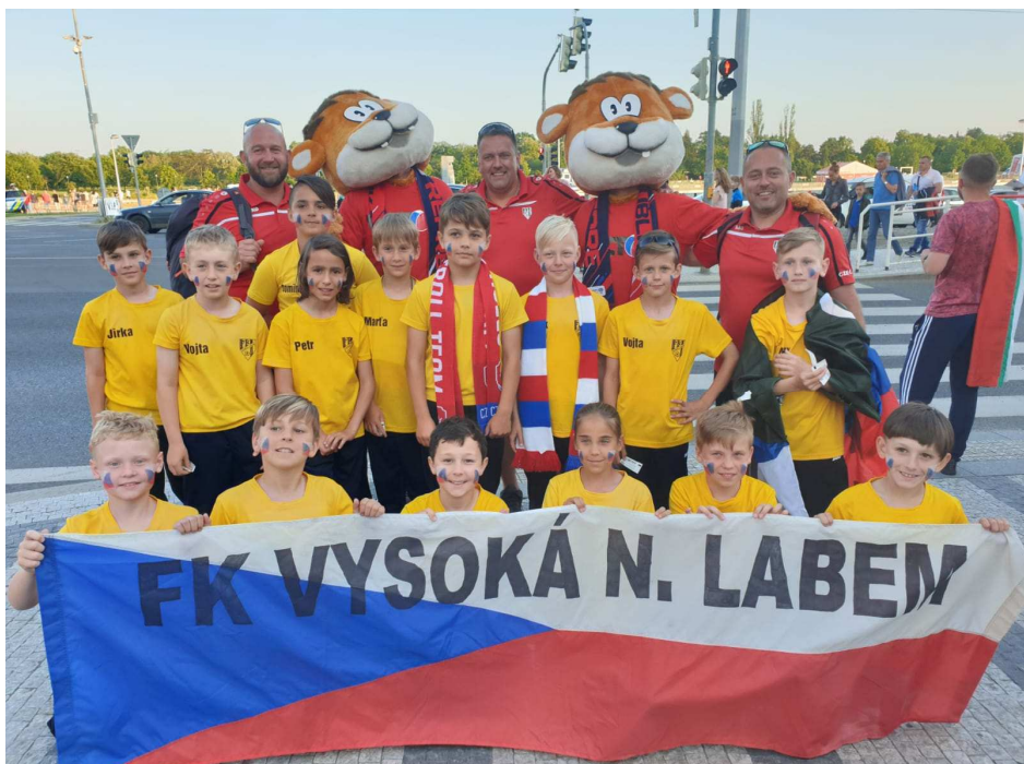
Tým starší přípravky vzorně reprezentoval obec na mezinárodním turnaji PRAGUE STRAHOV CUP 2019 a po výborném výkonu obsadil 3. místo. Gratulujeme!

Přeji všem krásné léto, plné sluníčka a pohody! Ing. Jiří Horák, starosta