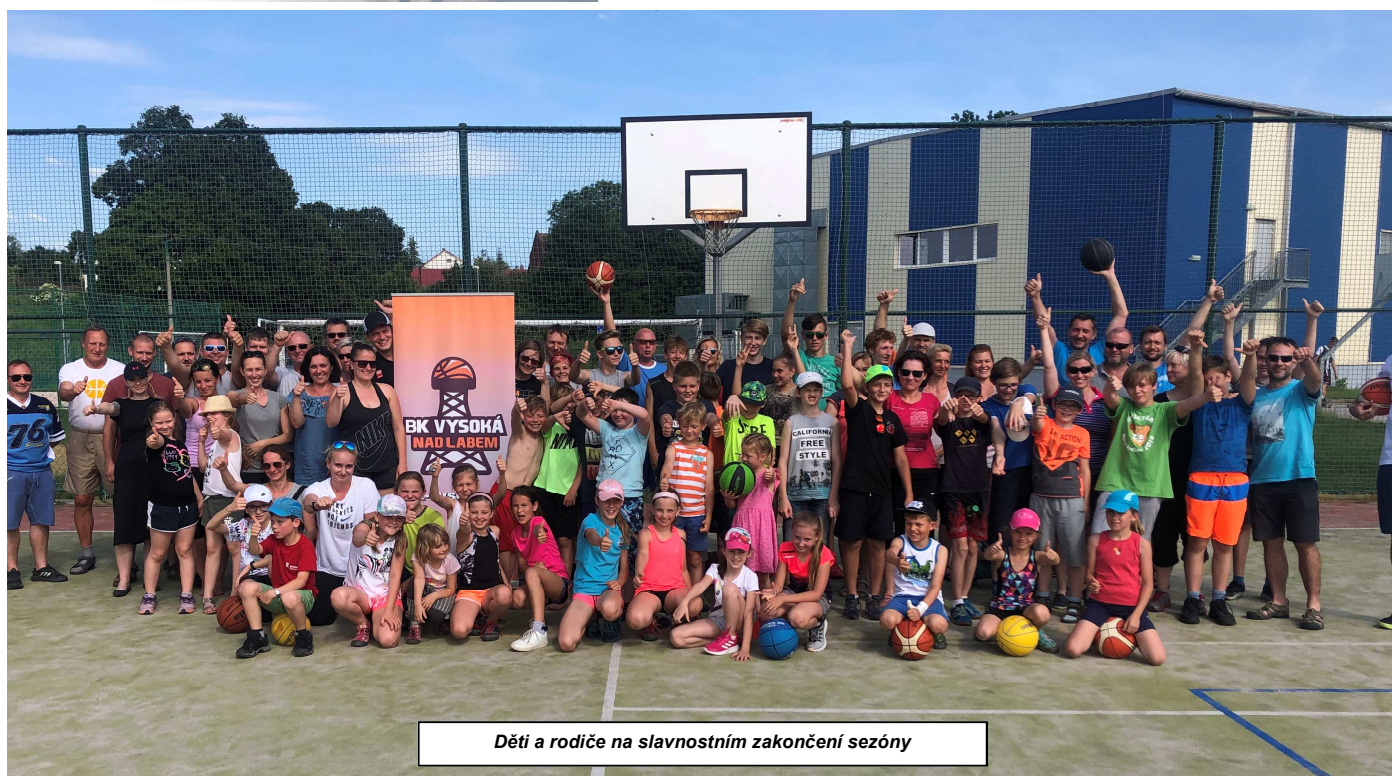
Děti a rodiče na slavnostním zakončení sezóny