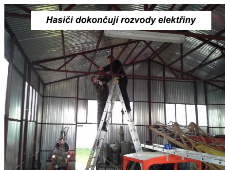
Hasiči dokončují rozvody elektřiny

4. listopadu byla svolána brigáda členů SDH z důvodu provedení rozvodů elektrického proudu po hasičském hangáru