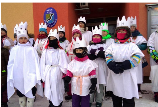
Když koledníci ráno 7. ledna 2017 vyrazili do ulic, bylo minus 17 stupňů! Tomu odpovídalo i jejich oblečení...

vedená dospělým průvodcem, dostane zapečetěnou pokladničku a svěcenou křidu. Podle počtu skupinek zvolíme trasu, kterou koledníci vyrazí a tuto trasu dosta-