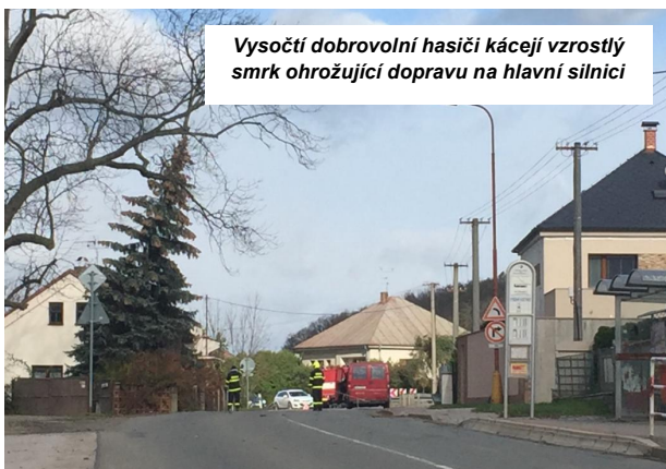
Vysočtí dobrovolní hasiči kácení vzrostlý smrk ohrožující dopravu na hlavní silnici

28. říjen držela JSDH zvýšenou hotovost na základě výstrahy o blížícím se silném větru od operačního střediska HZS KHK a byla tak připravena k okamžité pomoci. V neděli 29. října v 9:19 hod svolalo operační středisko HZS KHK vysokou zásahovou jednotku k výjezdu na technickou pomoc při odstranění nebezpečných stavů zapříčiněných orkánek Herwart. Z důvodů popadaných stromů nebyla průjezdná silnice mezi Vysokou a Opatovicemi. Naši hasiči napadané větve a kmeny z vozovky rychle odstranili a komunikaci opět zprůjezdnili. Zároveň projeli katastr obce Vysoká nad Labem a udělali průzkum škod a zahájili