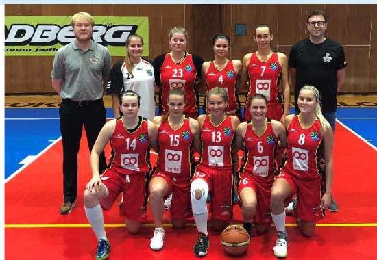
Od této sezóny 2017/2018 Vysokou reprezentuje i družstvo žen

rezervy extraligového celku Loko Trutnov. Jediné, co pokulhává jsou výsledky mužů „B“, kteří zatím nepotvrzují svými výkony loňského šampiona a se třemi porážkami a dvěma vítězstvími se krčí ve středu oblastního přeboru. Věříme však, že se o přední umístění ještě poperou.