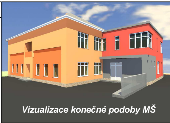
Vizualizace konečné podoby MŠ

prvním nadzemním podlaží, kde zastřešením terasy vznikne nová herna, pro děti budou připraveny dvě nová sociální zařízení a rozšířená výdejna jídel. Vše bude vybaveno novým nábytkem a zařízením. Další etapa úprav MŠ by měla proběhnout v roce 2010, kdy máme v plánu budovu