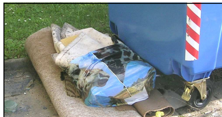
25.7.2009 - starý koberec u kontejneru „u točny“