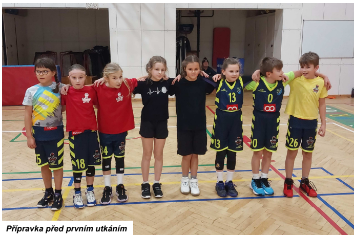
Příprava před prvním utkáním