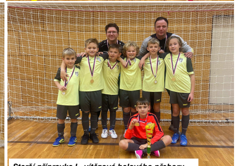
Starší přípravka I - vítězové halového přeboru