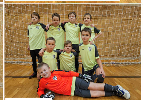
Starší přípravka II