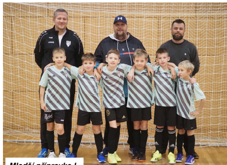
Mladší přípravka I