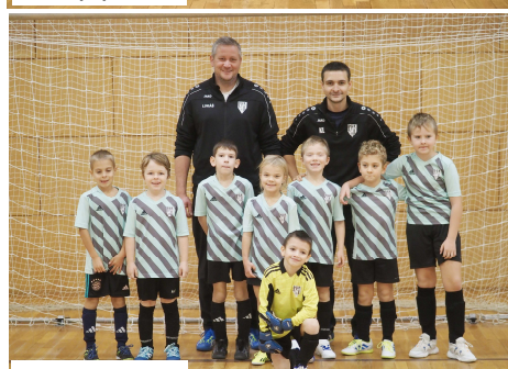
Mladší přípravka II