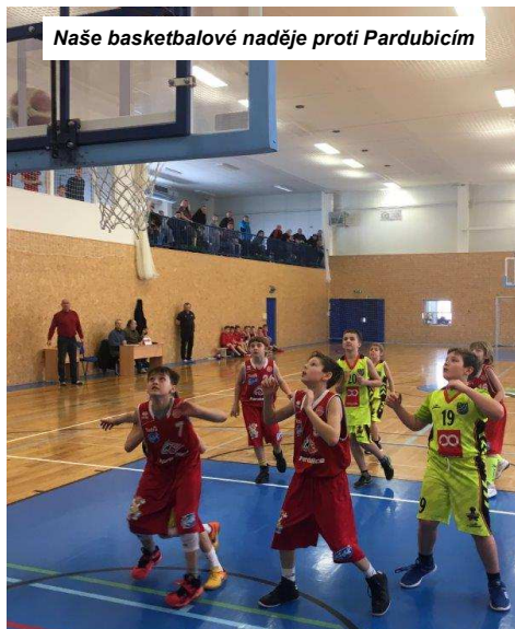
Naše basketbalové naděje proti Pardubicím