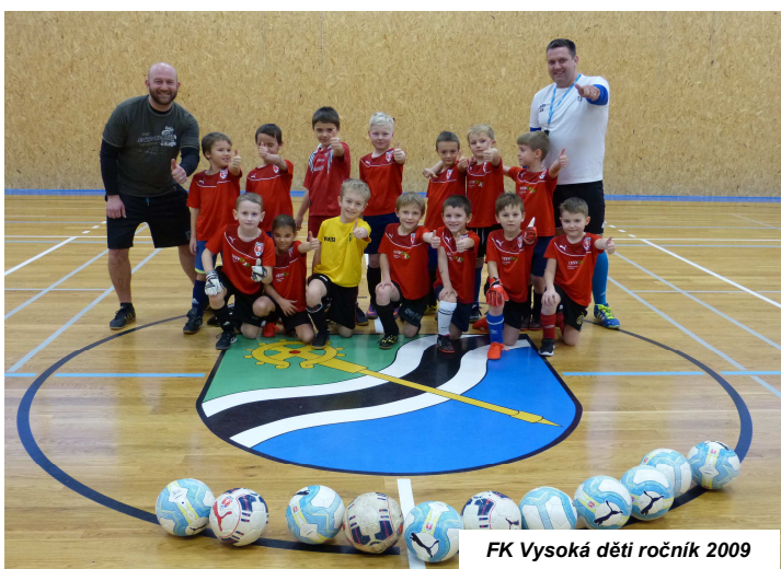
FK Vysoká děti ročník 2009