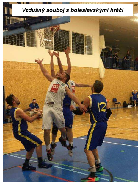
Vzdušný souboj s boleslavskými hráči