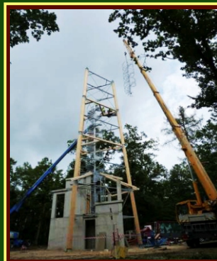
Zdvihání posledního osmimetrového dílu schodiště

Vzhledem k tomu, že Vysoká nad Labem leží na křižovatce značených turistických cest a cyklotras, rozhledna se pravděpodobně brzy stane vyhledávanou turistickou atrakcí celého regionu i kraje. Jedná se nejen o nejbližší rozhlednu k centru Hradce Králové a sídla Králové-hradeckého kraje, ale i o dominantu první etapy plánované cyklostezky „Mechu a perníku“ mezi Hradcem Králové a Pardubicemi.