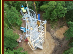
28. září 2013: usazení vrcholové části rozhledny o váze 7 tun