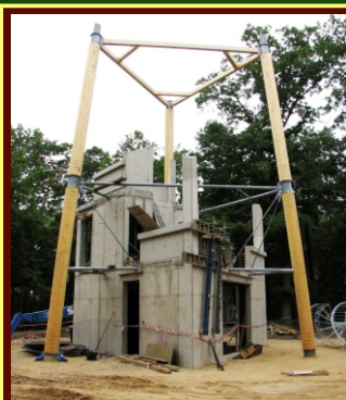
Počátek září 2013: dvě trojice šestimetrových sloupů, ocel a litý beton

Žádost o dotaci byla úspěšná, obec dostala částku 1,5 milionu korun a na jaře 2013 se začala stavět vlastní rozhledna s tím, že kofinancování projektu obec zatím doplatí ze svého rozpočtu. Kolaudace proběhla dne 3. října 2013 a rozhledna Milíř byla slavnostně otevřena v sobotu 12. října 2013.