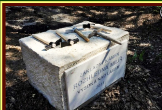
Základní kámen věnoval pan Otakar Rybišar z Vysoké nad Labem

Slavnostní poklepání základního kamene proběhlo dne 22. června 2011, za přítomnosti několika stovek občanů a čestných hostů.