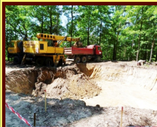
V základech je 300 tun betonu a 7 tun armatury, hloubení 3 metry hluboké jámy pro základy zajistili pánové Oto a Tomáš Hájkovi z Vysoké nad Labem.

Velmi nadějně vypadala možnost dotace z Regionálního operačního programu NUTS II Severovýchod, ve kterém bylo v roce 2010 připraveno hodně „Evropských peněz“, právě pro podporu cestovního ruchu. Bohužel, nezisková rozhledna dotaci nedostala, na rozdíl od jasně komerčních projektů typu soukromého penzionu nebo golfového areálu. Obrátili jsme se na vedení Královéhradeckého kraje, které od počátku našemu projektu fandilo, a to nás podpořilo částkou téměř 400 tisíc korun. Další 200 tisíc korun poskytla obec Vysoká nad Labem, občanské sdružení přidalo vlastní práci při terénních úpravách, kácení stromů atd. a na jaře 2011 byla zahájena stavba rozhledny - postavena základová deska a tři ocelové patky nosných sloupů.