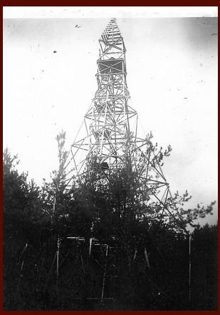
Původní rozhledna, fotografováno okolo roku 1940. Všimněte si, že okolní porost byl podstatně nižší.

Na počátku bylo vzpomínání pamětníků. Na staré časy, na tvář vesnice, na zajímavosti. Rozhledna byla ještě krátce po 2. světové válce dominantou obce. Tehdy měla výšku okolo 30 metrů a byla postavena ze smrkové kulatiny, v nejvyšším bodě v okolí tak, aby byla dobře viditelná ze všech stran. Vznikla zřejmě v rámci geodetického mapování republiky ve 30. letech 20. století a byla součástí celorepublikové sítě trigonometrických bodů. Stržena byla pravděpodobně v roce 1948, což dokumentuje zápis z obecní kroniky: „osm metrů dřeva ze stržené věže na Milíři dáno na zimu škole ku topení“. Dlouhá cesta od myšlenky obnovit původní rozhlednu k vlastní realizaci začala již v roce 2005, kdy bylo v hospůdce EDIK ve Vysoké nad Labem založeno občanské sdružení. Jeho cílem bylo obnovit původní rozhlednu, jež stávala v lese nad obcí krátce po II. světové válce. Členové se pravidelně scházeli a promýšleli možnosti vzhledu a konstrukčního řešení, které pak projektant zkoušel sladit s realitou. Projekt byl hotový v roce 2008, následovalo více než roční projednávání na úřadech. V polovině roku 2009 bylo vydáno stavební povolení. Začala fáze shánění peněz. Díky sponzorským darům od občanů i firem mělo sdružení na účtu částku okolo 150 tisíc korun. Z nich se hradily různé poplatky, úpravy projektu, geometrické plány, posudky atd., ale na vlastní stavbu to rozhodně nestačilo. Bylo nutno žádat o dotace, s tím se počítalo od začátku.