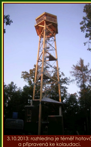
3.10.2013: rozhledna je téměř hotová a připravená ke kolaudaci.